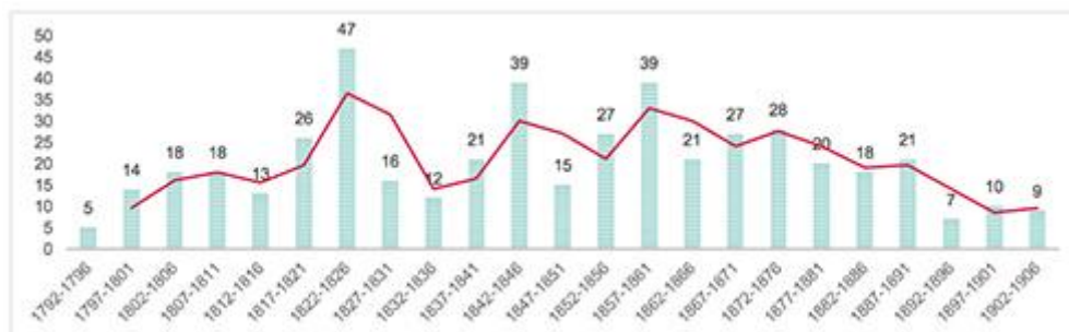
Figure 1 : Rythme des parutions de 1792 à 1902 (lissage sur 5 ans).

Parmi les résultats déjà publiés 9 , l'un des plus spectaculaires est le graphe réordonnant les titres par date d'édition (fig. 1). Cette visualisation, où la question de la représentation se déplace sur le terrain de l'image, montre en effet que les parutions, loin de décliner après l'Empire avec la « ruine complète » de l'école de Delille, thèse soutenue notamment par Sainte-Beuve et largement reprise ensuite, ont au contraire presque constamment dépassé ce niveau de 1820 à 1890, avec plusieurs pics notables, dont le premier coïncide avec le développement du romantisme poétique, tandis que la décrue n'intervient qu'à partir des années 1870.