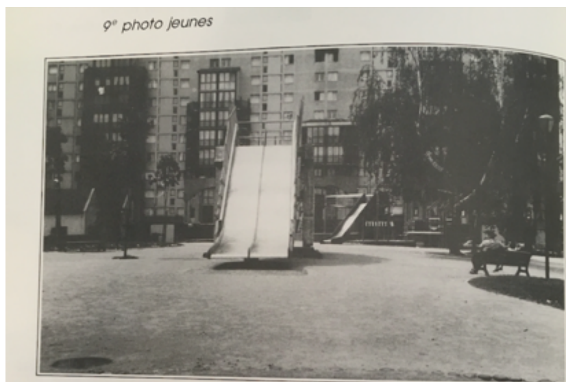
Fig. 4. « 9 e photo jeunes », terrain de jeu devant la barre la « Locomotive », quartier les Résidences, Belfort. Photographie prise par un jeune du quartier, Ma Maison , 1989.