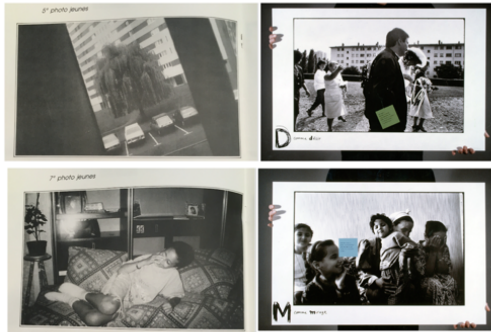
Fig. 5. À gauche : « 5 e photo jeunes » et « 7 e photo jeunes » extraites du catalogue institutionnel. À droite : deux panneaux de l'exposition portative Ma Maison correspondant aux lettres « D comme désir » et « M comme mirage », photographies André Lejarre, 1989.