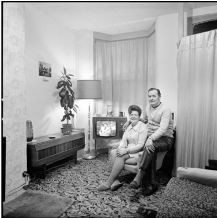
Fig. 9. Daniel Meadows, Martin Parr, June Street, Salford , 1973.

atteste de la visée utilitaire des images du fait de la dimension mémorielle du projet photographique. Selon le protocole mis en place, les photographes respectent les normes esthétiques identifiées au « style documentaire » (Lugon, 2001) lorsqu'ils adoptent un cadrage frontal, une distance juste entre le photographe et son sujet dans un souci de neutralité afin de répondre à une esthétique de l'analyse. La production en noir et blanc obéit à un idéal de lisibilité de la scène photographiée pour une description visuelle de ces intérieurs (Fig. 9). À l'inverse, André Lejarre désobéit au souci d'objectivité et de neutralité pour exprimer sa présence dans une sorte de corps à corps photographique (Fig. 10 et 11).