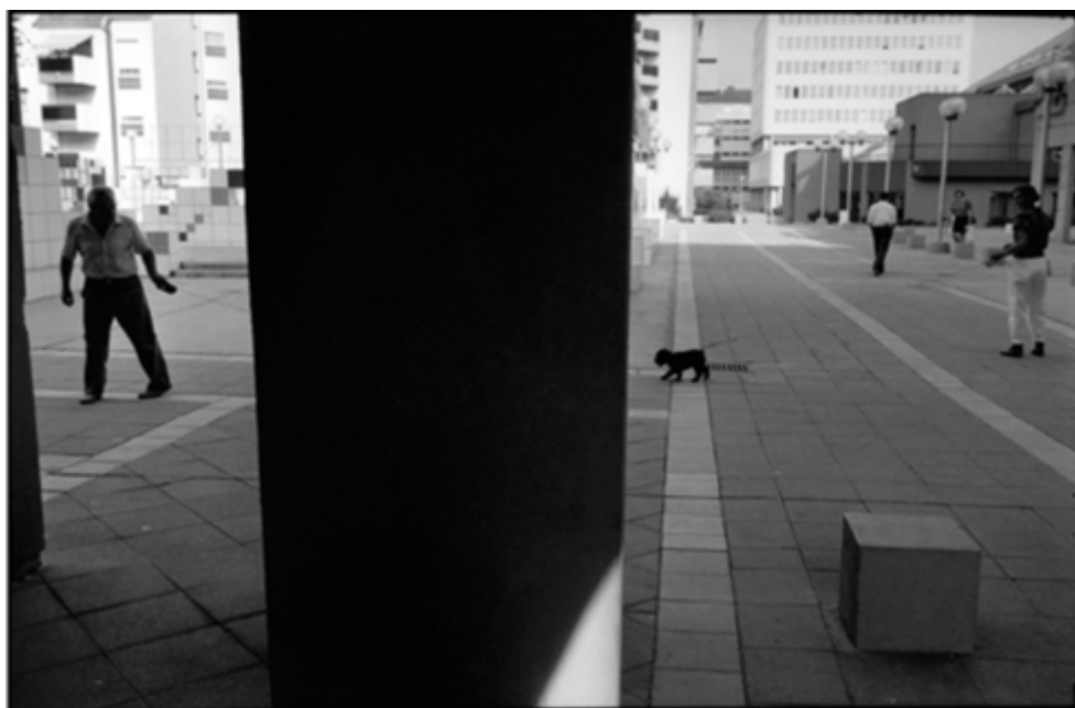
Fig. 3. André Lejarre, Ma Maison , quartiers HLM de Belfort, 1989.