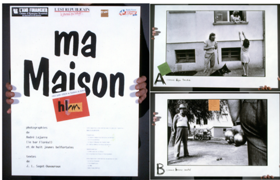
Fig. 2. Exposition Ma Maison , tirage 60x90 cm, photographie André Lejarre, texte Jean-Louis Sagot Duvouroux, conception graphique Alex Jordan/Grapus, 1989 ; exposition portative.

L'exposition se compose des 26 photographies d'André Lejarre sous forme d'un abécédaire. Jean-Louis Sagot-Duvouroux, écrivain, raconte une histoire faite de récits de vies au cœur des cités HLM, à partir d'un dialogue fictif, « drôle, poétique, questionnant la vie ensemble » (Lejarre, 2022, n. p.), entre deux jeunes amoureux, Michel et Christine. Alex Jordan écrit directement dans la marge la lettre de l'alphabet et sa déclinaison (A comme « Âge tendre », B comme « Bonne santé », etc.) à l'aide d'un feutre noir, écho au style énergique et typique de Grapus. Le dialogue est imprimé sur de petits carrés de couleur, collés de façon aléatoire sur chaque tirage. Les images d'André Lejarre sur les HLM belfortains 7 sont augmentées de tirages de participants : deux après-midis par semaine, huit adolescents 8 « fréquentant une Maison des Jeunes de Belfort, se sont portés volontaires pour cette petite aventure. Aucun d'eux n'[avait] déjà fait de photos. La Fnac de Belfort, partenaire de l'aventure, nous a donné un lot d'appareils jetables (elle réalisera les développements et tirages de lecture pour les jeunes) » ( ibid. ). Les photographies des jeunes de la cité des Résidences, encadrées, s'intercalent au milieu des images d'André Lejarre. Les cadres fantaisie, de petites dimensions, évoquent ceux que l'on dépose dans les intérieurs domestiques, sur les buffets ou les télévisions. L'objectif de l'exposition est de sensibiliser les locataires à leur environnement, « le pari de