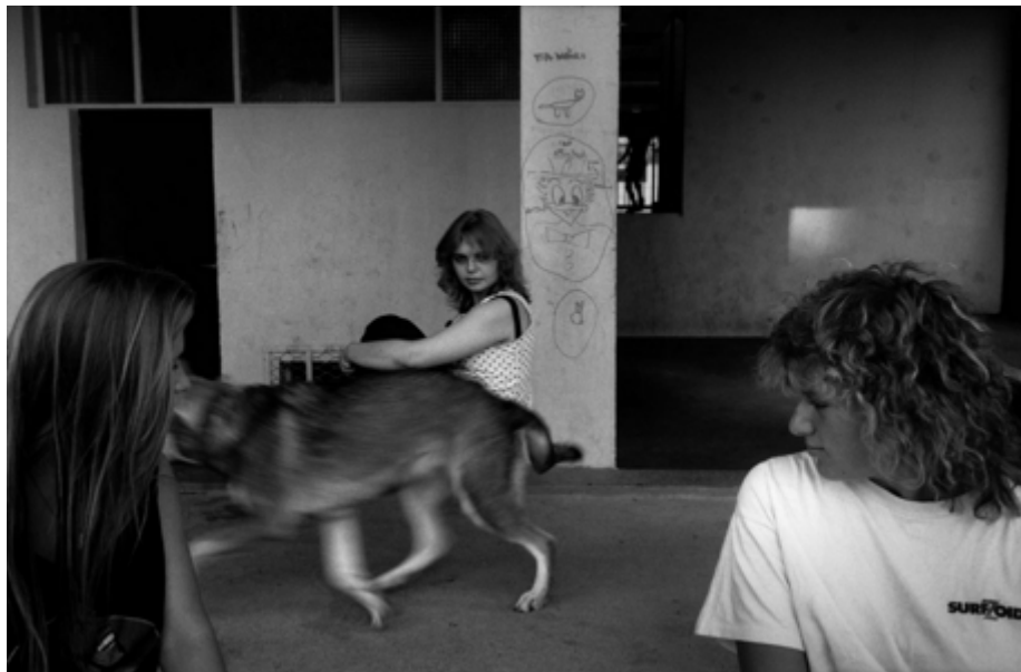
Fig. 7. André Lejarre, Ma Maison , quartiers HLM de Belfort, 1989.

L'écrivain avait contesté le titre de travail initialement choisi par le photographe, « 'La vie HLM' car trop banal et trop froid. [Jean-Louis Sagot-Duvauroux] propose 'Ma Maison', plus chaleureux et plus en accord avec le projet de description et de valorisation de l'habitat social » (Lejarre, 2022, n. p.). Quant à André Lejarre il avoue que, même si d'ordinaire il est pessimiste, il prend « généralement des photos plutôt souriantes 15 ». Pourtant, ses images ne s'accordent pas avec un regard convenu et consensuel, « elles ne montrent pas que le bon côté des choses » ( Le Pays , 2022, p. 1). Il y a des temps suspendus, peut-être de l'ennui, dans certaines scènes du quotidien qui se déroulent dans un décor urbain peu chaleureux, où se lisent les traces d'usure, et parfois même de délabrement (Fig. 7).