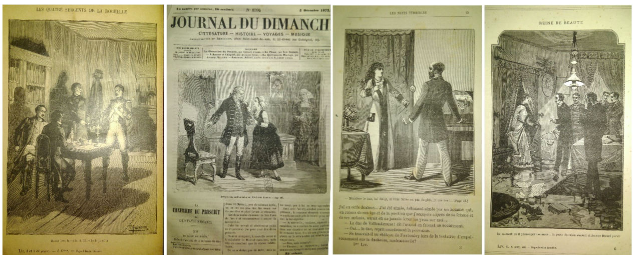
Fig. 3 Gravures de journaux-romans et de livraisons : l'organisation de l'espace et les poses des personnages réfèrent à un modèle théâtral

et le répertoire des poses des personnages, cherche à convoquer globalement l'imaginaire dramatique afin de susciter l'émotion du lecteur. Ce recours au référent théâtral n'est d'ailleurs pas limité à l'espace de l'image. C'est aussi la théâtralité qui prévaut dans le texte, et qui explique par exemple (bien plus que la nécessité de tirer à la ligne ) l'emploi massif des dialogues ou la manière dont les personnages s'expriment en aparté. Au xix e siècle, c'est largement le paradigme théâtral qui domine les imaginaires du feuilleton. Mais justement, le rythme de théâtre n'est pas celui du cinéma, et tout comme, dans le texte, les dialogues mélodramatiques étirent le temps de l'émotion en la commentant, les images donnent à voir des postures qui visent à en donner une idée d'ensemble, loin des visions cinématiques qui prévaudront dans les images du xx e siècle.