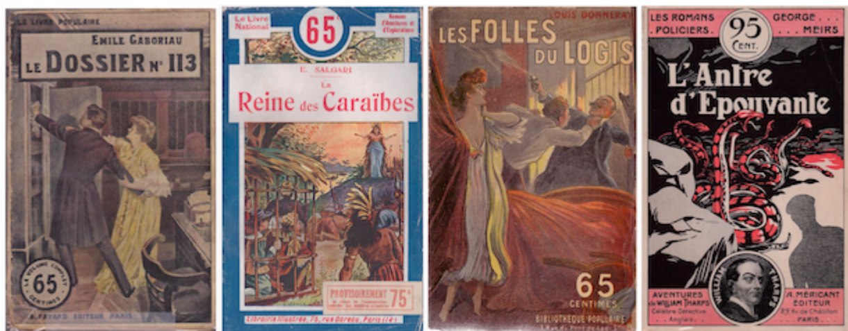
Fig. 4 Le « Livre populaire » d'Arthème Fayard et quelques-unes des collections qu'il a inspirées avant-guerre.