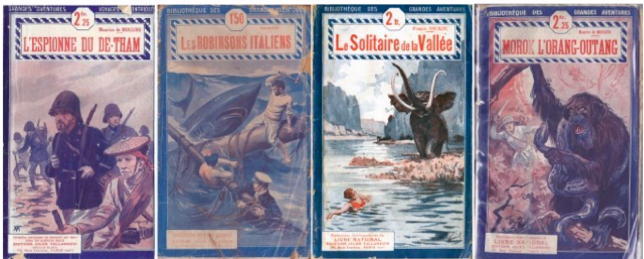
Fig. 5 Les illustrations de couverture comme manifestation des logiques de communication sérielle (Tallandier, « Bibliothèque des grandes aventures »)

Certes, il y a peu de différences en apparence entre les images des romans d'aventures coloniaux du xx e et celles des récits exotiques du xix e siècle, mais leur usage n'est pas le même, précisément parce que l'œuvre est prise dans le réseau des couvertures qui l'entourent et en relation avec lesquelles elle est évaluée. De fait, ces dernières mettent en scène le double mouvement de standardisation et de singularisation caractéristique des pratiques sérielles. C'est bien parce qu'il y a serie stéréotypée d'images qu'il y a singularisation : chaque couverture fétichise quelques détails qui définiront les éléments d'attraction pour le consommateur (un cadre spatial, un type d'événement, une série d'intertextes... fig. 5) 7 , et détermineront son choix. Et si nous voyons de la répétition, l'amateur y voit de la variété.