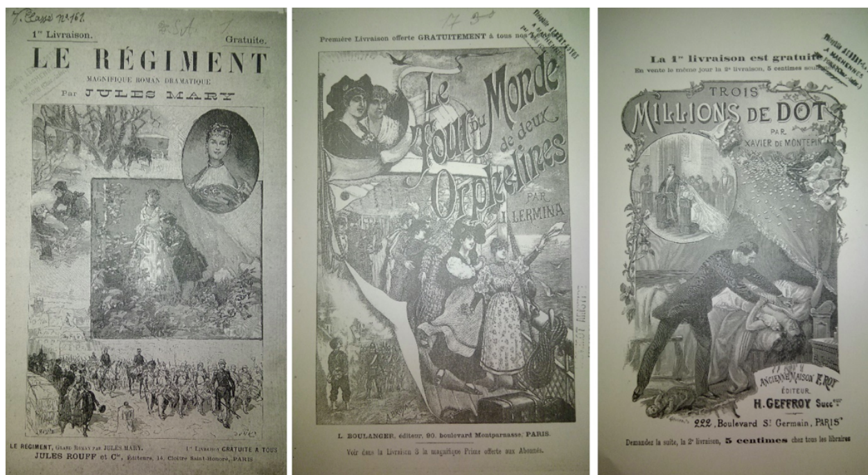
Fig. 2 Trois couvertures amovibles de livraisons à illustration polyptique valorisant la variété épisodique.