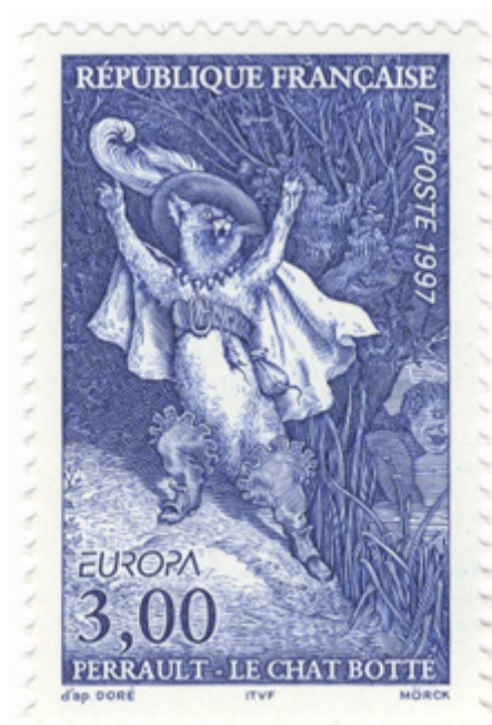
Fig. 5. Timbre « Europa, Perrault - Le Chat Botté », 1997.