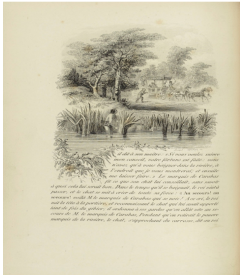
Fig. 12. – ill. de H. Thiriet, Martinet, 1930, p. 21.