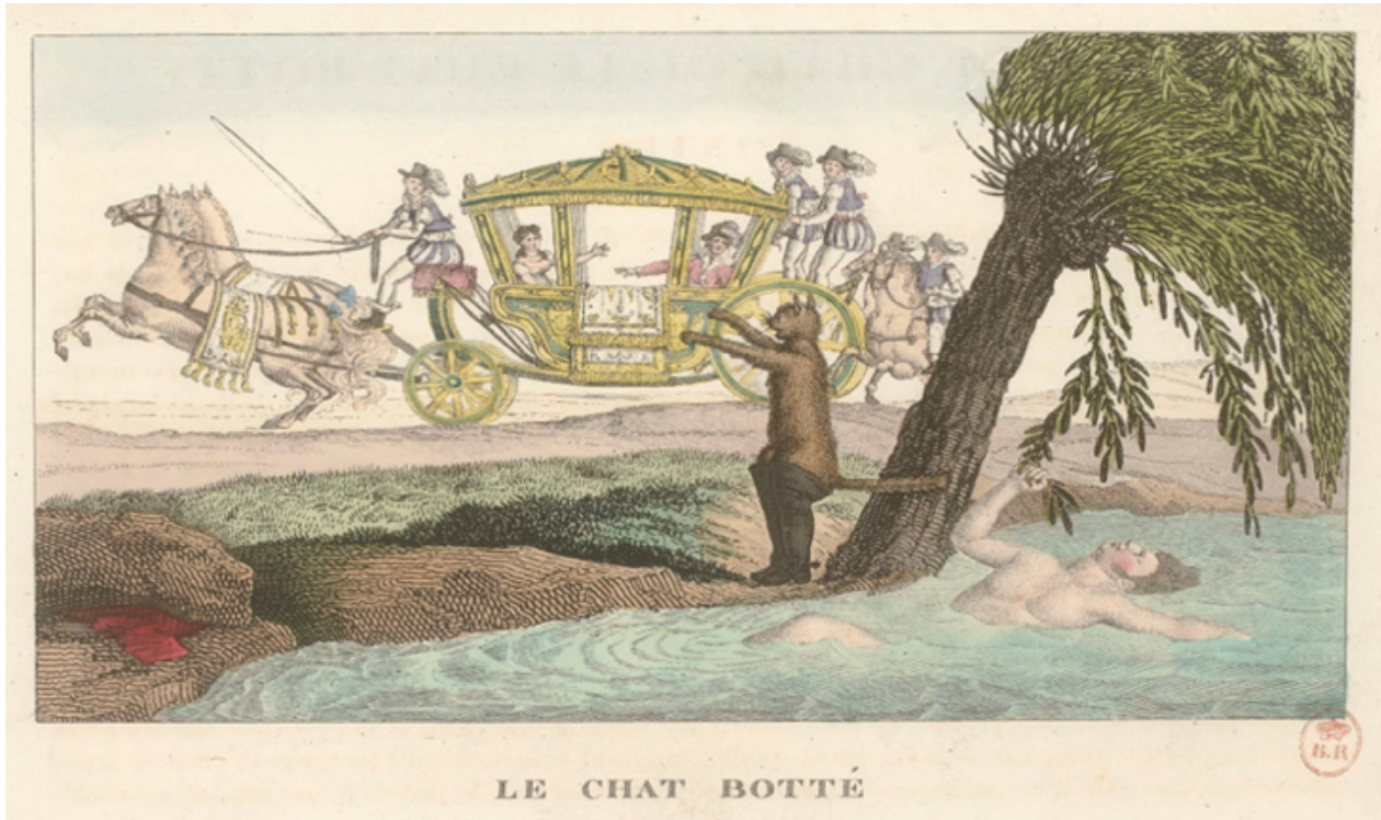
Fig. 10. –Dessin de J. J. Grandville, Le marquis de Carabas feint de se noyer, vers 1837 © Nancy, Musée des beaux-arts.