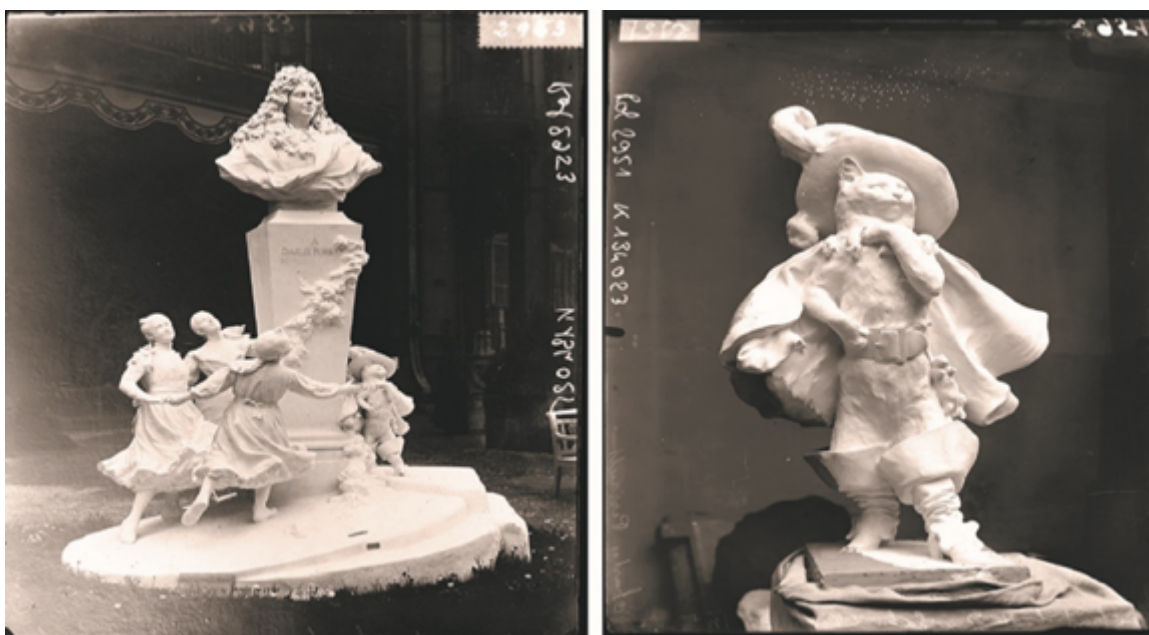
Fig. 4.1 et 4.2 – Négatifs sur verre, Monument Charles Perrault et Chat botté, Pech, 1908.

La figure du chat de Doré, après avoir emblématisé l'édition Hetzel, puis des adaptations théâtrales du conte « Le Chat botté », apparaît dès le début du XX e siècle pour représenter Charles Perrault lui-même, commémoré comme père fondateur des contes de fées. Ainsi, lorsque le sculpteur Gabriel Pech reçoit en 1903 la commande d'un monument en hommage à Perrault, il inclut étonnamment le « maître chat » dans sa composition : l'œuvre, achevée en 1908 et placée au Jardin des Tuileries à Paris, est constituée du portrait en buste de Perrault sur un piédestal, autour duquel est sculpté un groupe de trois fillettes et d'un chat assez similaire à celui de l'image du chat appelant à l'aide de Doré.