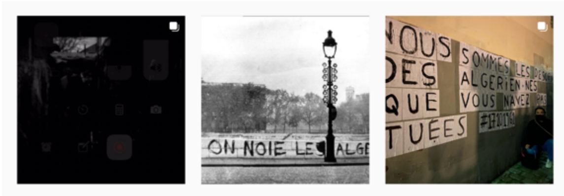
Feed de @decolonisonslefeminisme : « Nous sommes les descendant•es des algérien•nes que vous n'avez pas tué•es #17.10.1961 » + « Ici on noie les algériens » @decolonisonslefeminisme, 27 octobre 2020.

Faire mémoire peut également passer par le rappel des luttes passées et leurs réactualisations, ce qu'ont fait les membres du collectif Décolonisons le féminisme en allant coller dans Paris « Nous sommes les descendant•es des Algérien•nes que vous n'avez pas tué•es #17.10.1961 ».