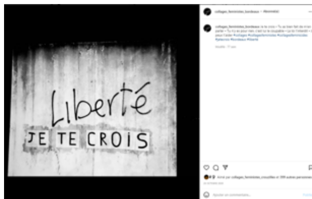
« Liberté » + « Je te crois »

Les slogans viennent transformer les lieux qui les accueillent qui, à leur tour, leur confèrent parfois une signification particulière. Ainsi, de nombreux collages sont trouvés sur des supports qui viennent en altérer la signification, ou qui abritent d'autres formes de littératures sauvages avec lesquelles ils entrent en dialogue. À Bordeaux, les colleur•euses ont placé le slogan « Je te crois » en dessous d'un tag « Liberté », lui conférant une double lecture : à la fois il apporte un soutien aux victimes de violences sexistes 17 et en même temps il exprime, de manière lyrique, un désir de liberté. Les deux écritures urbaines ensemble deviennent un énoncé presque poétique — qui ne peut manquer de renvoyer au célèbre poème « Liberté » de Paul Eluard, dont le « J'écris ton nom » serait remplacé par une déclaration d'adhésion et de confiance.