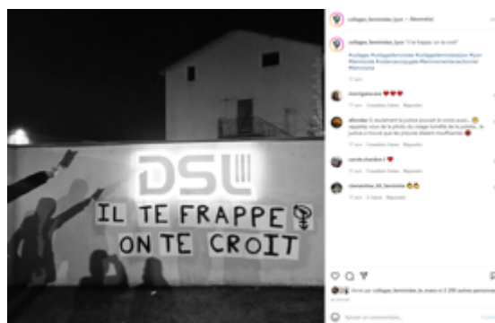
« Il te frappe on te croit »

Les militant•es rendent hommage et font mémoire en allant coller la veille de la date « anniversaire » du massacre des Algériens par la police française le 17 octobre 1961. Le post suivant du collectif est le tag tristement célèbre « Ici on noie les Algériens » : Instagram permet ici de mettre côte à côte deux littératures sauvages contestataires, et de les mettre en perspective et de faire entrer en écho les luttes au fil du temps. Dans le même mouvement, le renvoi vers cette lutte historique et la mise en lumière de la lourde histoire coloniale et meurtrière de la France, légitime le combat que mènent les militant•es aujourd'hui. Toujours dans cette optique de la transmission, via Instagram toujours, iels partagent également des extraits du documentaire « Octobre à Paris » de Jacques Panijel qui dénonce les répressions des Algérien•nes par l'État français en 1974.