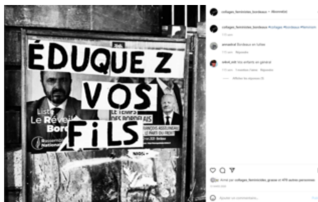
« Éduquez vos fils » + affiches électorales @collages_feministes_bordeaux, 13 mars 2020.