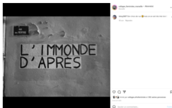
« Rue des Vertus » + « L'immonde d'après » @collages_femicides_marseille, 8 juillet 2020.

choix de rue [smiley] mais on en est très très loin ! ». François Provenzano parle à cet égard d'un « conflit de sémiologie » : différents signes se répondant, s'influençant mutuellement (Provenzano, 2019).