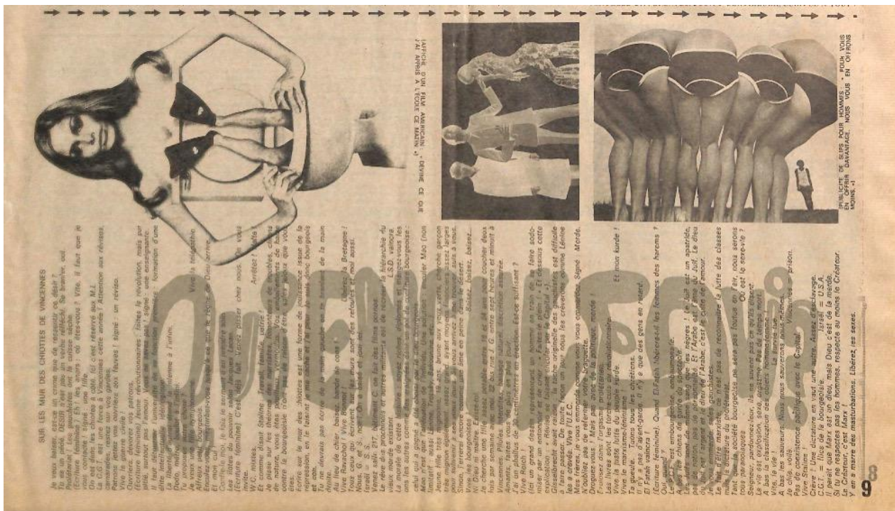
Figure 3 : Tout ! , n° 1, 23 septembre 1970, p. 9 (détail).

« Si un révolutionnaire souhaite qu'on encule publiquement un ennemi de classe, un grand patron, un chef d'État capitaliste ou un dictateur fasciste, c'est que l'image de la sodomie est automatiquement associée chez lui à celle d'humiliation, de dérision, de vengeance. » (« Les pédés et la révolution », 23 avril 1971, p. 9)