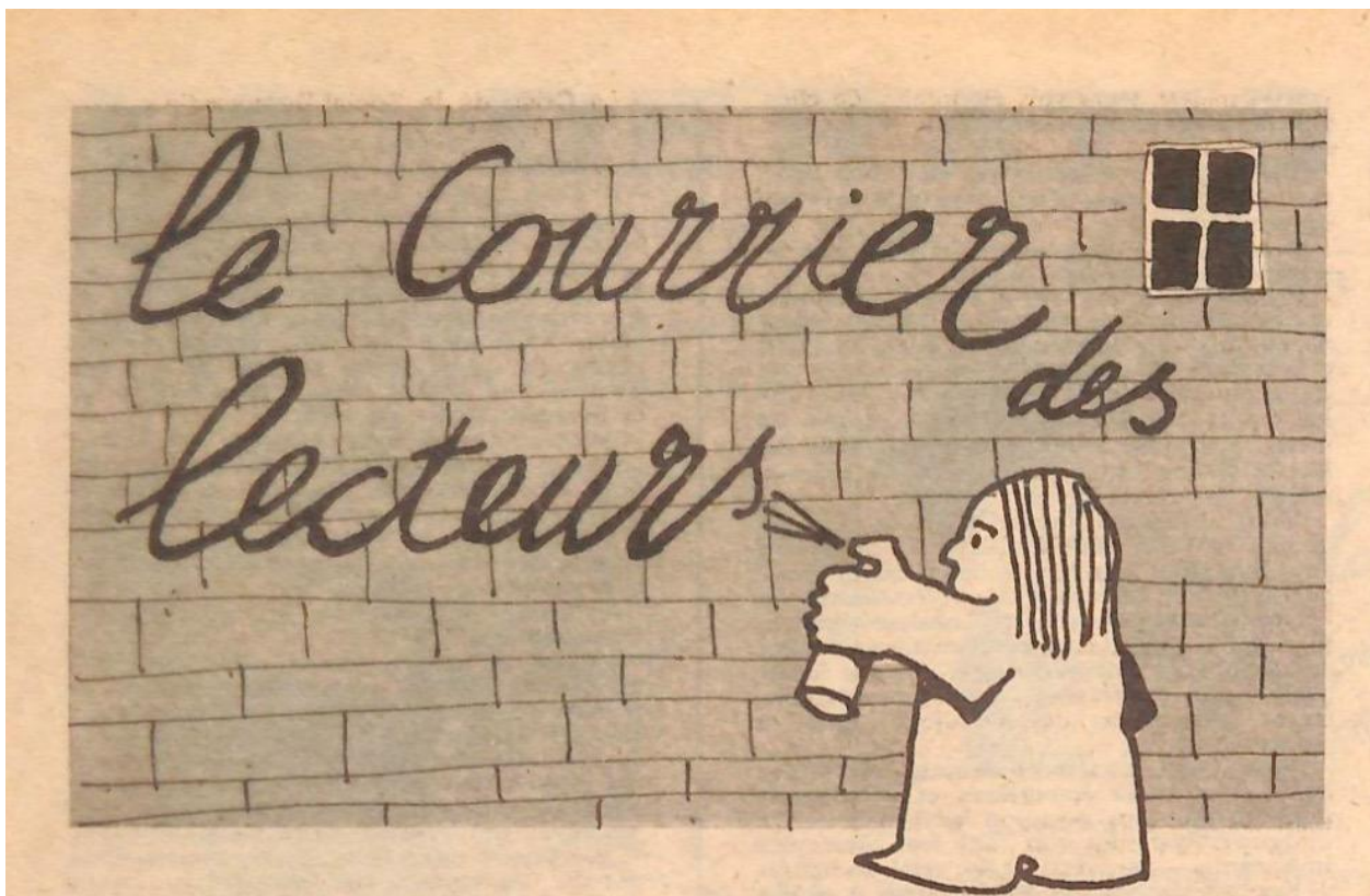
Figure 5 : L'Idiot international , n os 8-9, juillet-août 1970, p. 37 (détail).

lisent et celles et ceux qui écrivent, comme l'indique le dessin révélateur qui coiffe le courrier des lecteurs dans L'Idiot international (fig. 5). Les dominés se constitueraient en un contre-public où ils cesseraient d'être parlés par leurs porte-paroles, accédant par la prise d'écriture à une véritable autonomie politique et jetant les bases d'une démocratie radicale, en une insurrection de l'écrit contre les effets de domination de la représentation politique.