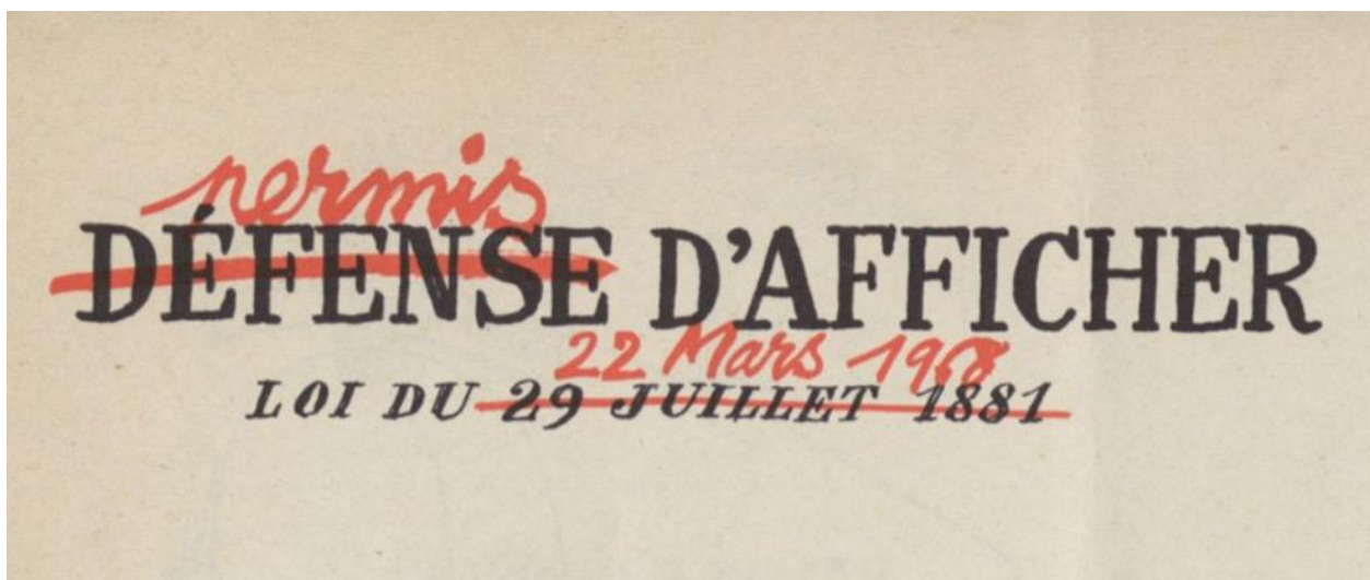
Figure 1 : L'Enragé , n° 1, [mai] 1968, p. 4 (détail).